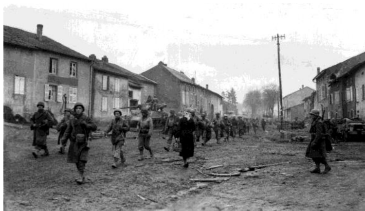
Ces soldats du 358th Infantry Regiment traversent Metzervisse une fois le village libéré