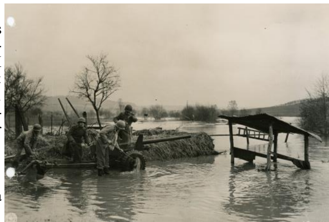
Ces soldats américains profitent des inondations de la Moselle pour nettoyer leur canon antichar de 57 mm

Mais c'est sans compter sur la météo lorraine... Le 8 dans l'après-midi, le ciel est bas et une pluie dense s'abat sur les environs de Thionville. Les précipitations sont telles que le niveau de la Moselle monte rapidement, le fleuve sortant de son lit à plusieurs endroits. Si cela force les Allemands sur la rive droite à évacuer leurs positions avancées, cela va aussi compliquer grandement le franchissement du fleuve !