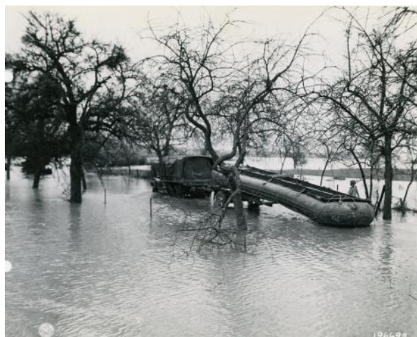
Près de Cattenom, ces soldats américains emmènent un élément de construction qui servira à édifier le pont sur la Moselle le 11 novembre 1944

Le ravitaillement arrive, en août 1944, du Royaume-Uni par bateau et est déchargé en Normandie puis acheminé par camions. Pour le carburant, s'il n'est pas acheminé en camion-citerne, il l'est au moyen des fameux « jerrycans », des bidons d'essence d'environ 20 litres. Mais Patton n'est pas le seul à avoir besoin de ravitaillement, puisque les armées britanniques et américaines en Belgique ont aussi besoin de carburant pour leurs chars. En bref, début septembre 1944, la 3 e armée n'a pas suffisamment de ravitaillement pour atteindre en force Thionville. Patton lui-même dira à son supérieur, le général Eisenhower, le 2 septembre : « S'ils ont faim, mes hommes peuvent mâchouiller leur ceinturon, mais mes chars ont besoin d'essence pour avancer ! »