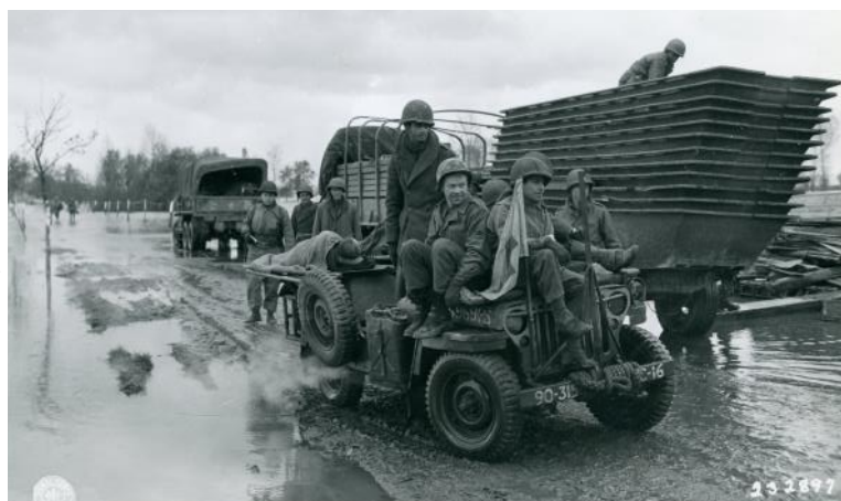
Prise le 11 novembre près de Cattenom, cette photo montre une Jeep médicale acheminer vers l'arrière les soldats blessés lors du franchissement de la Moselle. On distingue, en arrière-plan, les embarcations dans lesquelles les Américains ont traversé le fleuve.