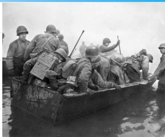
Franchissement de la Moselle par des soldats américains, entassés dans un canot

Les 2e et 3e groupes se retrouvent au sud de Haute-Ham pour s'engouffrer dans la forêt vers Kuntzig. Les chars américains entrent dans le village depuis l'actuel chemin des vignes et signalent par radio à 14h que le village est entièrement libéré. Mais quand les Américains poussent vers Stuckange, ils tombent sur des champs de mines très denses à la sortie sud de Kuntzig et décident de ne pas continuer davantage.