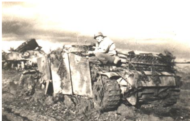
Ce soldat américain pose sur l'épave d'un char allemand détruit lors de l'attaque de Distroff, le 15 novembre 1944. En arrière-plan se trouve l'épave d'un char américain dont la tourelle a été projetée en l'air par une explosion

Le 16 novembre, le capitaine Foster, commandant le 344e bataillon d'artillerie américain installé près de Cattemom, appelle son homologue Falvey du 358th Infantry Regiment de Distroff. « Falvey, tu as une gomme sur toi ? Si oui, tu peux effacer le nom de Stuckange de la carte, on s'en occupe dans 10 minutes » lui dit-il avec son accent du Texas. Le village va être bombardé toute la journée et ce n'est qu'au crépuscule qu'une patrouille américaine entrera dans Stuckange, qui n'est alors plus défendu par les Allemands. Les Américains reprendront leur progression vers Metzeresche et Metzervisse, puis vers l'Allemagne... Laisant les habitants de Kuntzig, Distroff, Valmestroff et Stuckange profiter de leur liberté retrouvée.